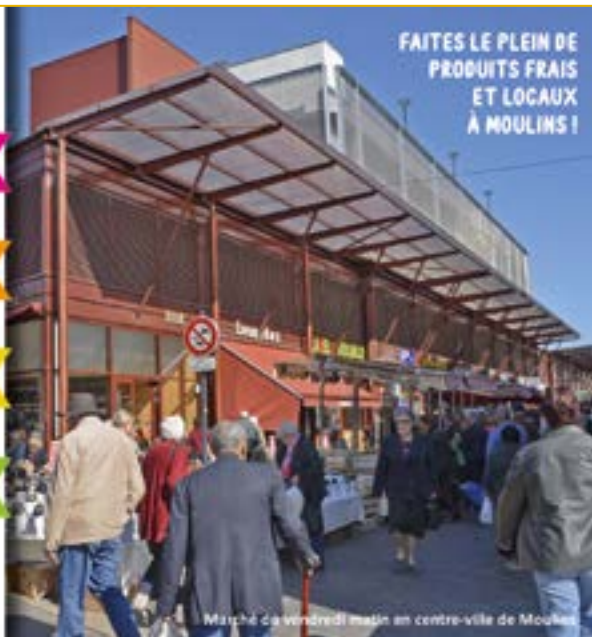
Marché du vendredi matin en centre-ville de Moulin

FAITES LE PLEIN DE PRODUITS FRAIS ET LOCAUX À MOULINS !